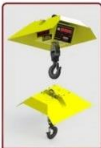
Acessório Chapéu contra Sol e Chuva

Obrigatoriamente a manilha (alça superior da balança) deve estar assentada no colo do gancho