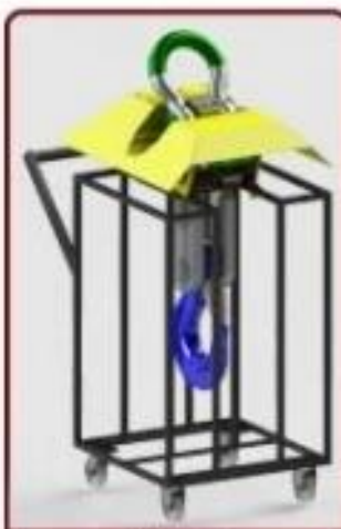
Acessório Carrinho para Transporte