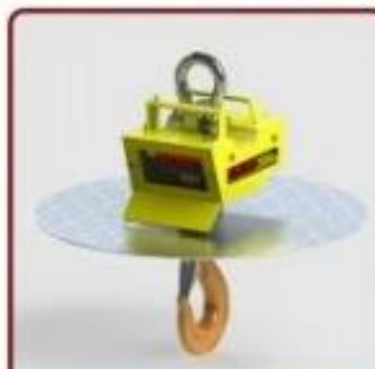
Acessório Disco Atenuador de Calor

*Consulte Outros Acessórios para Balanças Suspensas